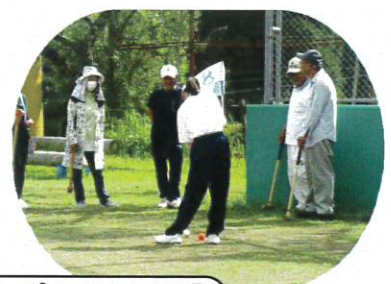
【ふれあいスポーツ大会】