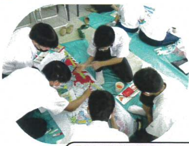
【地域夏祭りに向けての灯籠作り】