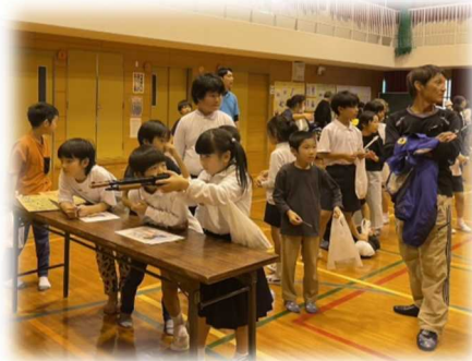
射的に長蛇の列が