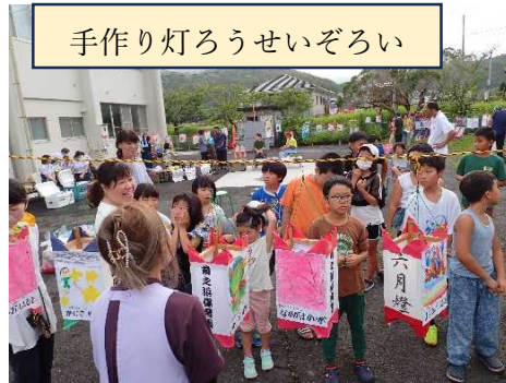
手作り灯ろうせいぞろい