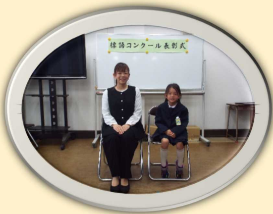
<最優秀賞者・優秀賞者>