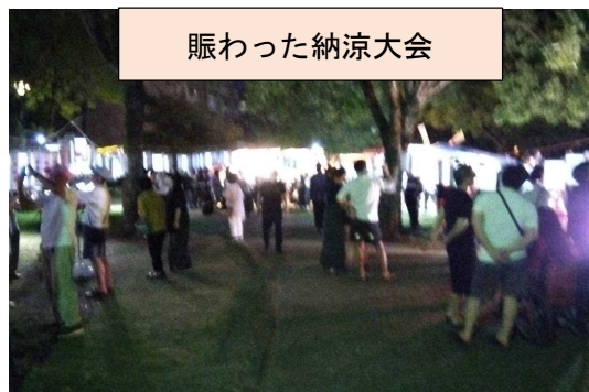
賑わった納涼大会