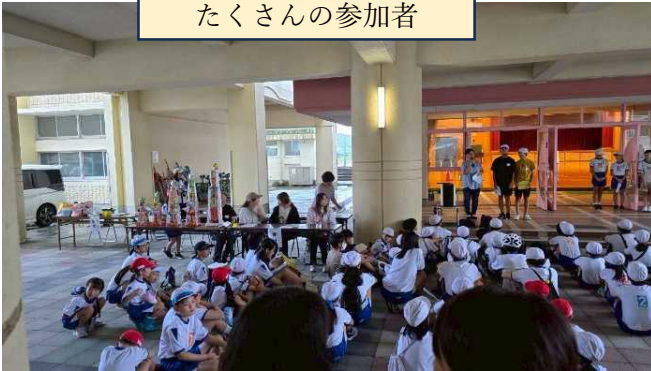
たくさんの参加者