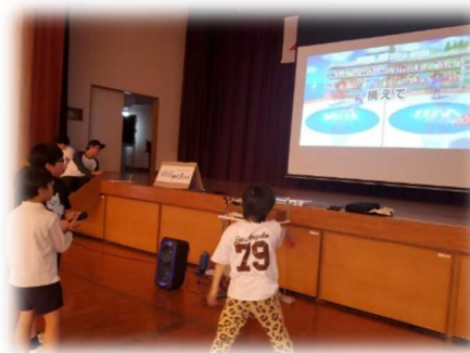
トーナメントで大盛り上がり